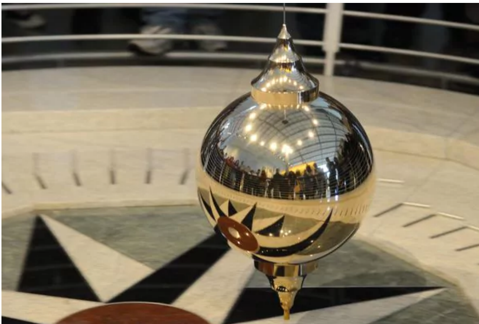
Allais demostró que durante un eclipse la precesión es revertida

El último trabajo publicado al respecto, precisó la astrónoma, es de 2010 y corresponde al argentino Horacio Salva. En "Searching the Allais effect during a total solar eclipse of 11 July 2010", publicado en la revista Physical Review, el investigador analizó el eclipse que se pudo ver en el país. En sus resultados encontró ninguna evidencia del efecto Allais.