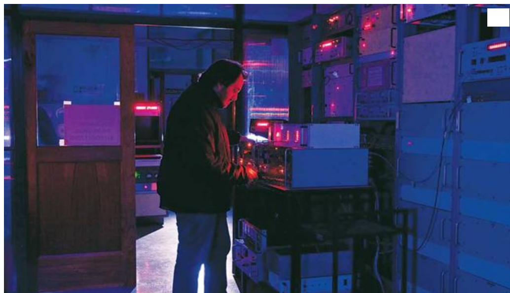
Zona de control. Desde aquí, los ingenieros configuran el radiotelescopio.