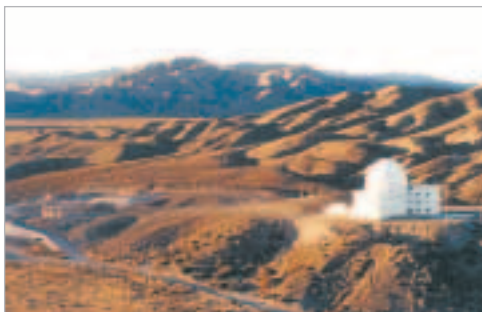
El Leoncito. Este es el Complejo Astronómico

El nuevo telescopio cubrirá las frecuencias de entre 0.05 y 22 gigaciclos (GHz), con una resolución angular sin precedentes. Las especificaciones del diseño tienen como meta lograr una resolución de 1 décimo (0.1) de segundo de arco, a una frecuencia de 1.420 megaciclos (MHz). Esa resolución equivale al tamaño angular bajo el que se vería una moneda argentina de 1 peso ubicada a 2,4 km de distancia. El poder de resolución y calidad de imagen provistas por SKA serán cruciales para estudiar la formación y evolución de estrellas, galaxias y cúasares en los con-