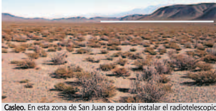
Casleo. En esta zona de San Juan se podría instalar el radiotelescopio

“Cuando no hay inversión en ciencia y tecnología, pierde el país. Los planteles del CONICET están envejeciendo”, dice Morras