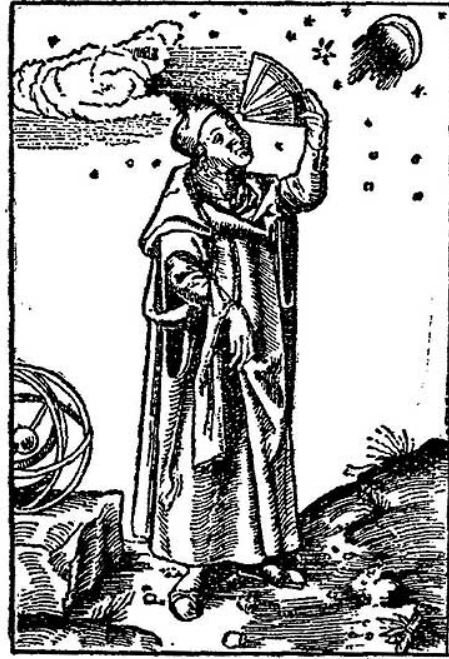
Tolomeo mide la altura de los astros con el cuadrante. (Cosmografía de Münster, 1550)

Para medir se enfoca a través del sorbete el objeto (por ejemplo una estrella o un planeta), en ese momento otra persona lee el número que la cuerda señala en la escala del astrolabio. Esa es la altura del objeto.